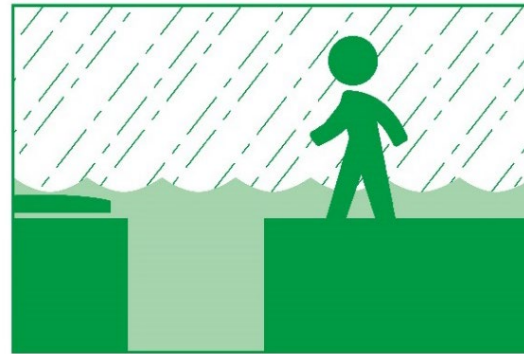
すいろ き マンホールや水路に気づかず