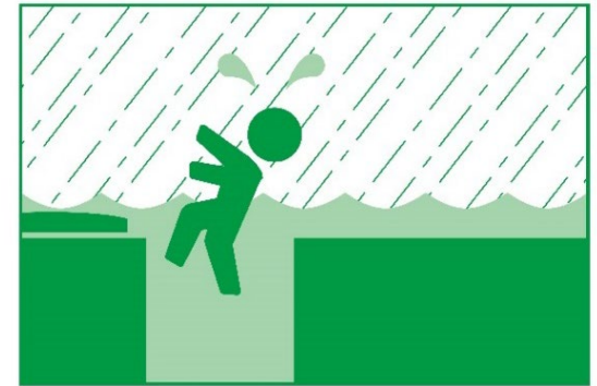
お 落ちてしまうことがあるよ！