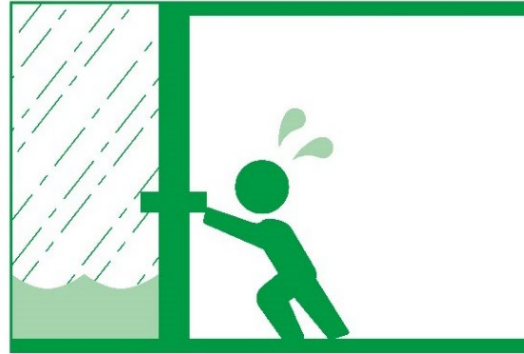
センチみず 30cm 水がたまると、