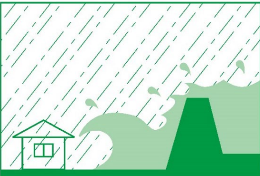
あしもと み なかある 足下が見えない中歩くと、